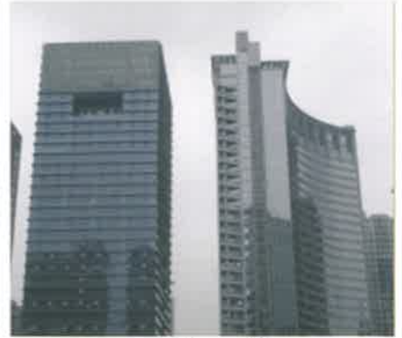
Shenxi Hong Kong